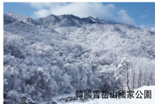
韓國雪岳山國家公園

寶是韓國珍貴稀少名產枳椇子果實和高麗人參主根部分之精華濃縮萃，經過長達二十年的研究和研發，純天然無添加任何中西藥材製造而成，枳椇子果實生長在韓國海拔50-800公尺無污染的山林，被名醫李時珍稱為“金果樹”，對肝硬化，脂肪肝，肝炎有很好的療效。午餐後前往【明洞商圈】。明洞有多個高層綜合購物中心，最典型的建築是【樂天百貨店】。後前往【韓國土特產店】自由購物。晚餐後回酒店休息(早,午,晚)